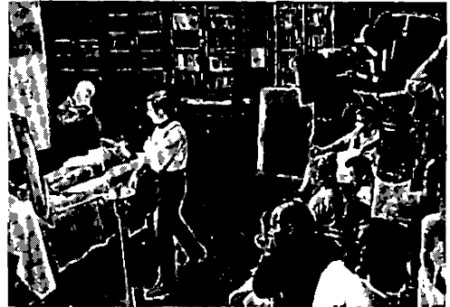
L'enfant sauvage (tournage)

La Nouvelle Vague des années 60 filma (typa) interminablement des individus que le hasard, leur orgueil ou la méchanceté ambiante avaient mis en marge de la « société », du « monde ». Bresson, depuis Pickpocket , fournit le modèle idéologique et formel à la mise en scène de cette marge. Idéologique, en choisissant pour héros de ses films les moins récupérables (sinon par Dieu, qui voit tout) : un pickpocket ou une sainte. Formel, en filmant des regards que rien au monde ou dans le hors-champ (c'est la même chose) ne pouvait combler, suturer. Bresson invente le dispositif qui permet de fétichiser le face à face entre l'acteur-objet comme révolté et le sujet-auteur comme bénéficiaire de la révolte. Jouir de ce que l'autre laisse échapper. « Modèle. Tu lui dictes des gestes et des paroles. Il te donne en retour (ta caméra enregistre) une substance. » (Notes sur le cinématographe.)